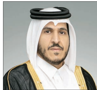
وزير التجارة والصناعة

وبمشاركة دولية من هيئات حكومية ومنظمات دولية ومؤسسات مالية وأكاديمية في مجالات الاقتصاد والمال