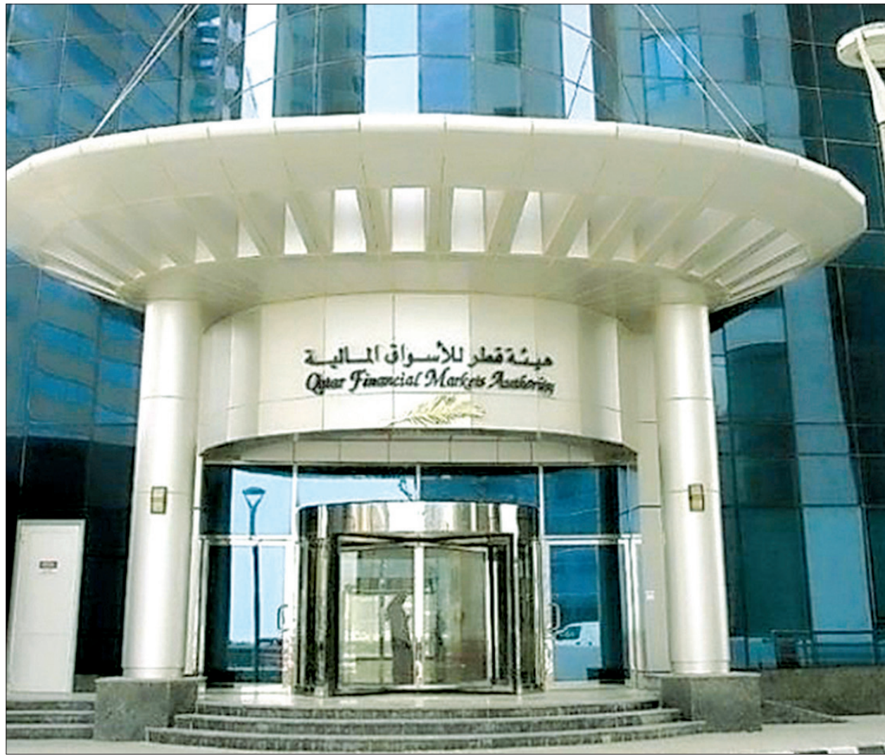
هيئة قطر للأسواق المالية

ترخيص الأفراد والشركات لمزاولة الأنشطة والوظائف الخاضعة لرقابة الهيئة.