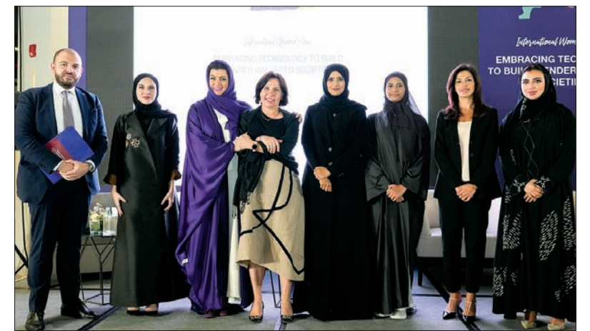
جانب من الاحتفال

اقتصادية كبيرة، وتبقى الدول التي تفضل في تحقيق ذلك متأخرة عن نظيراتها. لقد ساعد تمكن المرأة دولة قطر على الازدهار بشكل غير مسبوق، حيث لعبت المرأة دوراً ريادياً في تقدم ونمو البلاد.