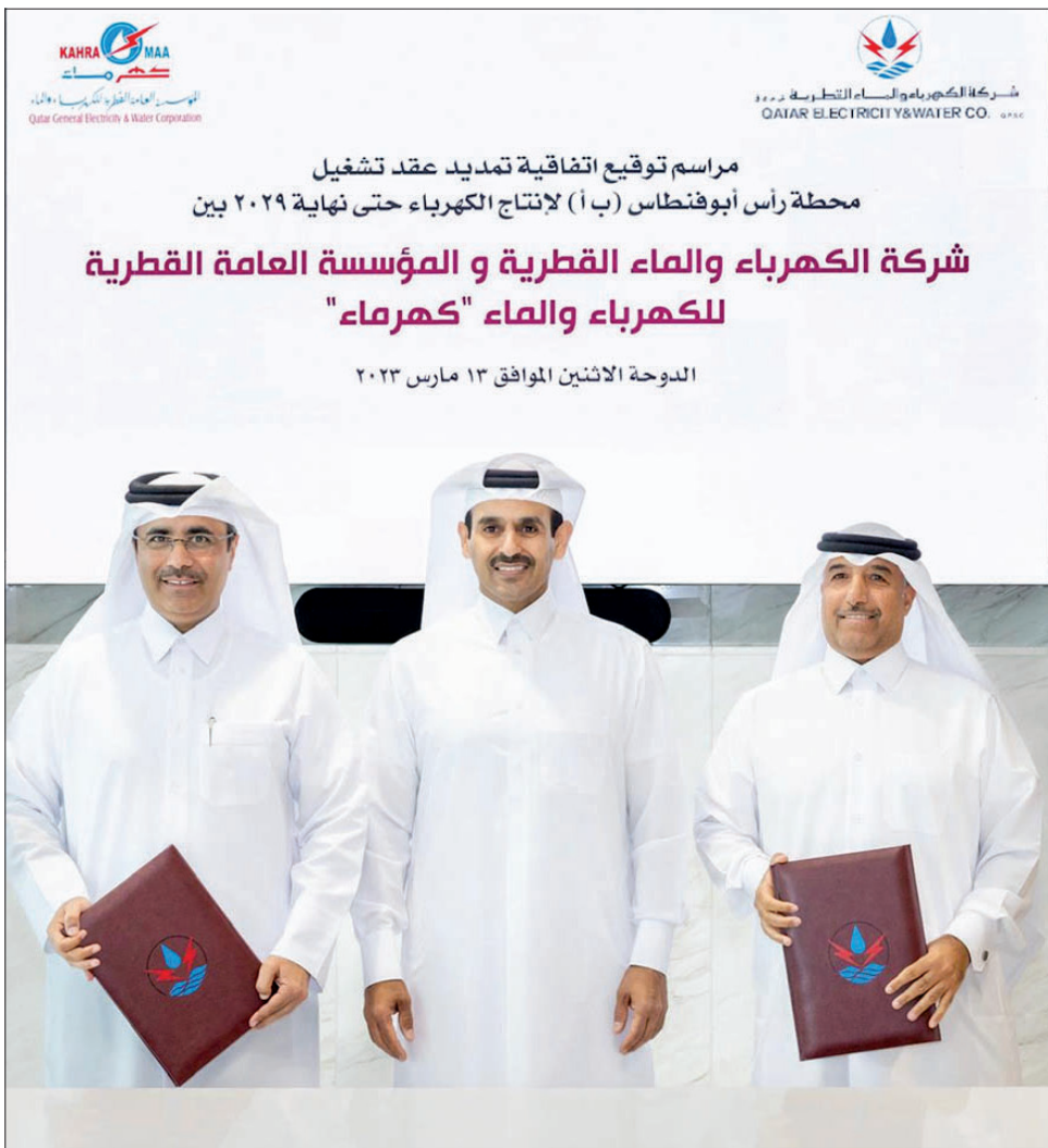
حفل توقيع الاتفاقية

وموظفي كهرماء وشركة الكهرباء والماء القطرية على أدائهم المتميز في تأمين متطلبات قطر من المياه والكهرباء. من جانبه أكد سعادة المهندس عيسى بن هلال الكواري، رئيس كهرماء، أن التنسيق الوثيق مع شركة الكهرباء والماء القطرية وقطر للطاقة أمر بالغ الأهمية لاستمرار النمو الاقتصادي وعملية التنمية في دولة قطر. وأضاف أن كهرماء ملتزمة بتوفير وتوزيع الكهرباء والمياه عبر بنية تحتية متطورة ومستدامة، مواكبة لأحدث المستجدات التقنية في هذا القطاع إقليمياً ودولياً، ومبينة على التحليل العلمي لأنماط الاستهلاك ومعدلات الإنتاج. بدوره أكد المهندس محمد ناصر الهاجري، العضو المنتدب والمدير العام لشركة الكهرباء والماء القطرية أن الشركة تسخر جميع جهودها لتلبية احتياجات الدولة من الكهرباء والمياه بكفاءة عالية وبما يتماشى مع أهداف رؤية قطر الوطنية 2030 في التنمية والتطوير واستراتيجية الحكومة الرشيدة، لافتاً إلى حرصها على الارتقاء بالجودة في عمليات الشركة كافة للوصول إلى مستويات غير مسبقة من الموثوقية والتميز.