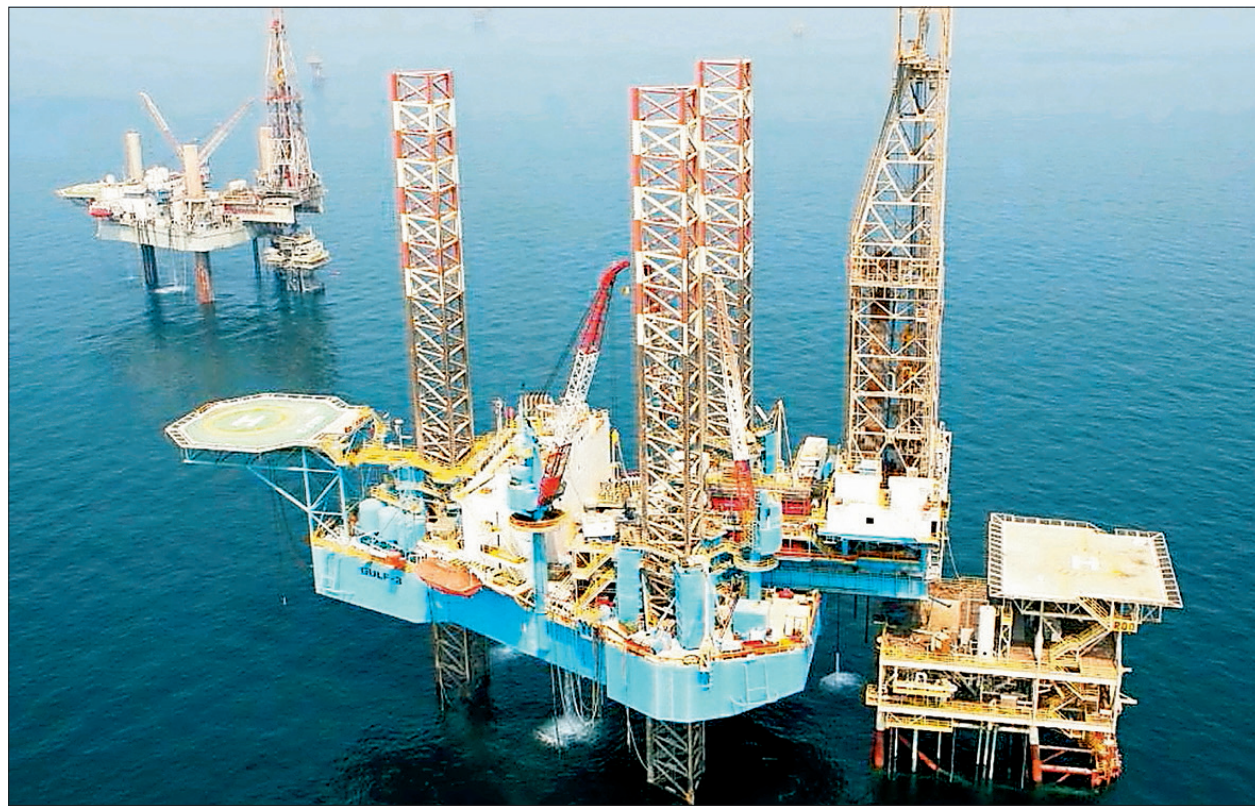
منصة تابعة لشركة الخليج الدولية للخدمات

وأخذاً في الاعتبار الإستراتيجية العامة للشركة وأفاق النمو في المستقبل، فإن إعادة هيكلة الدين هي أمر حتمي، ليس فقط للوصول إلى المستوى المثالي من الفوائد، بل أيضاً للحصول على قدر أكبر من المرونة لإدارة السيولة والتخفيف من حدة الضغوط التي يتعرض لها الوضع المالي للمجموعة. وتحقيقاً لهذه الأهداف، تعمل إدارة المجموعة بصورة حثيثة للوصول إلى الهيكل المثالي للدين، والذي من شأنه أن ينمّر في نهاية الأمر عن خفض المديونية في المركز المالي للمجموعة بشكل تدريجي، وبما يتوافق مع الإستراتيجية العامة للمجموعة.