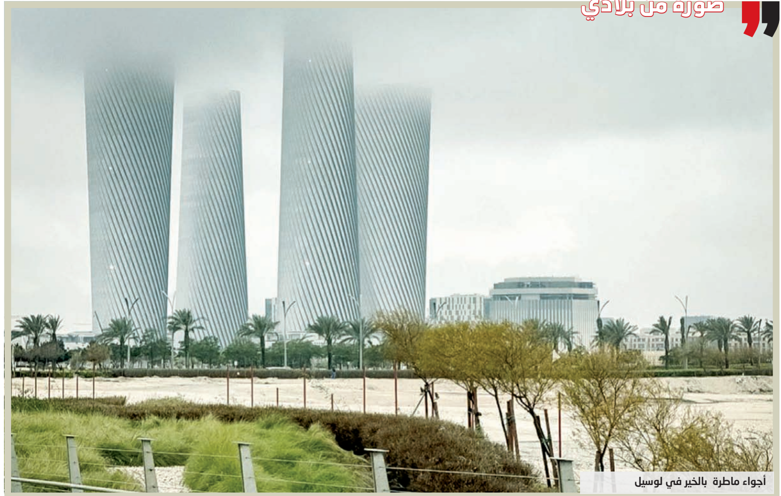
أجواء مطرة بالخير في لوسيل