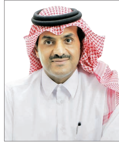
الشيخ خالد بن خليفة آل ثاني

فعلى مستوى قطاع التموين، فقد قامت الشركة بالمضي قدماً في إتمام