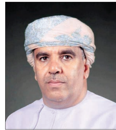
د. نبهان الحرامي

المكتبات والمعلومات وعميد كلية الآداب والعلوم الاجتماعية بجامعة السلطان قابوس بسلطنة عمان، دور مكتبة قطر الوطنية باعتبارها مركزاً إقليمياً للاتحاد الدولي لجمعيات ومؤسسات المكتبات «الإفلا» للحفاظ على التراث في الوطن العربي، مؤكداً أن المكتبة حظيت بهذه المكانة، نظراً لموقعها الثقافي والعلمي في المنطقة، وبفضل نشاطها المتواصل في ربط المعرفة بالمجتمع، وكذلك شبكة التواصل العلمي التي أسستها المكتبة مع المنظمات الإقليمية ودولياً، لافتاً إلى أن اختيار مكتبة قطر كمركز إقليمي للإفلا على تعريف العالم بالتراث الفكري العربي يعزز من التواصل الحضاري بين الشرق والغرب.