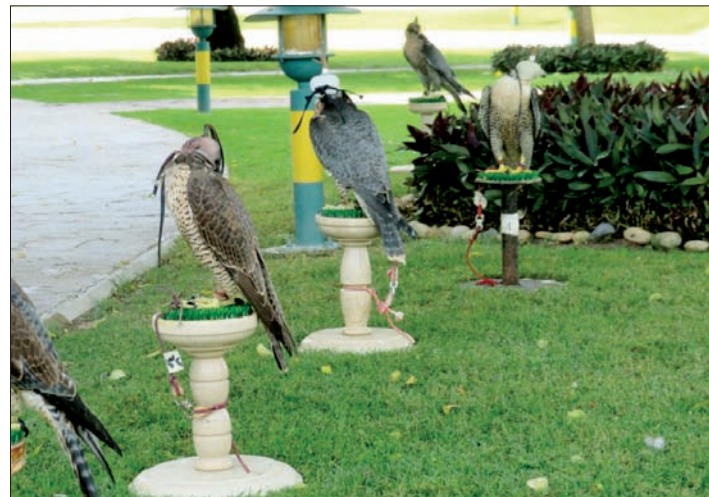
صقور في مقر جمعية القناص بكتارا