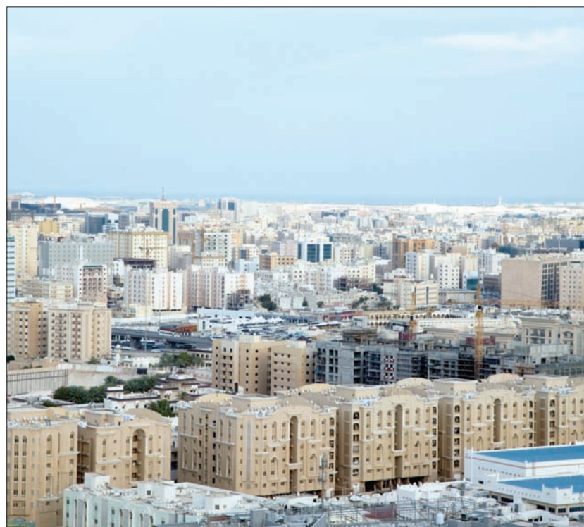
المباني السكنية تستحوذ على النصيب الأكبر من رخص البناء

أعلن جهاز التخطيط والإحصاء البيانات الشهرية عن رخص البناء وشهادات اتمام المباني الصادرة عن كافة بلديات الدولة.