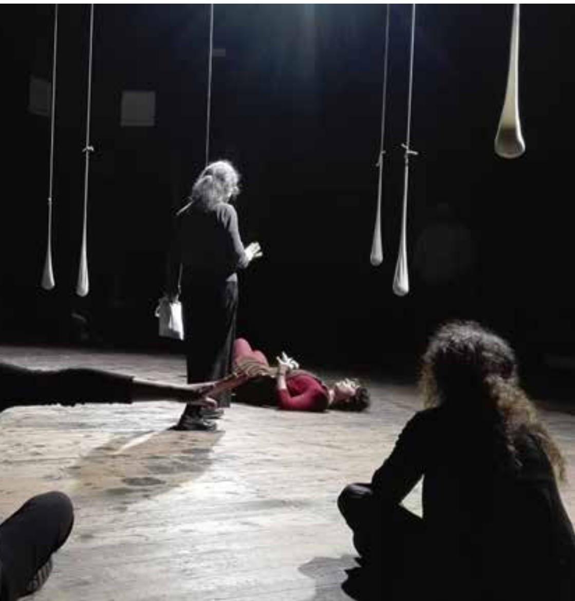
Répétition de La terra dei Lombrichi , mise en scène de Chiara Guidi (Societas). Cesena (Italie, décembre 2019).