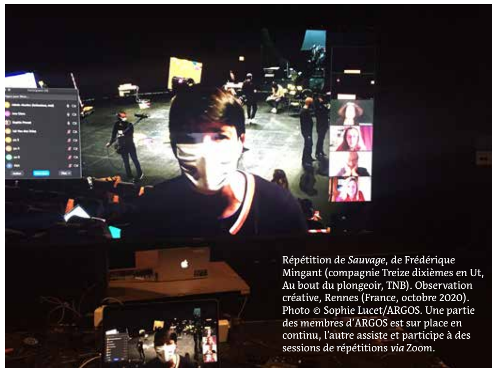
Répétition de Sauvage , de Frédérique Mingant (compagnie Treize dixièmes en Ut, Au bout du plongeur, TNB). Observation créative, Rennes (France, octobre 2020). Une partie des membres d'ARGOS est sur place en continu, l'autre assiste et participe à des sessions de répétitions via Zoom.

Une partie des membres d'ARGOS dans la salle immersive tandis que les autres assistent à la répétition dans la salle Serreau.