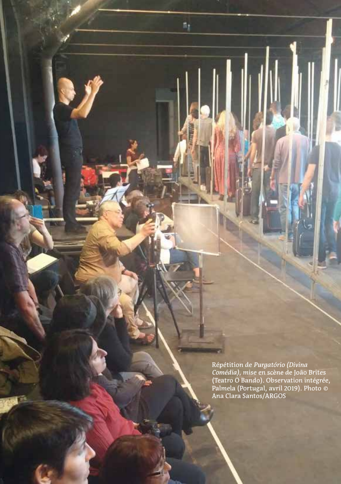
Répétition de Purgatório (Divina Comédia) , mise en scène de João Brites (Teatro O Bando). Observation intégrée, Palmela (Portugal, avril 2019).